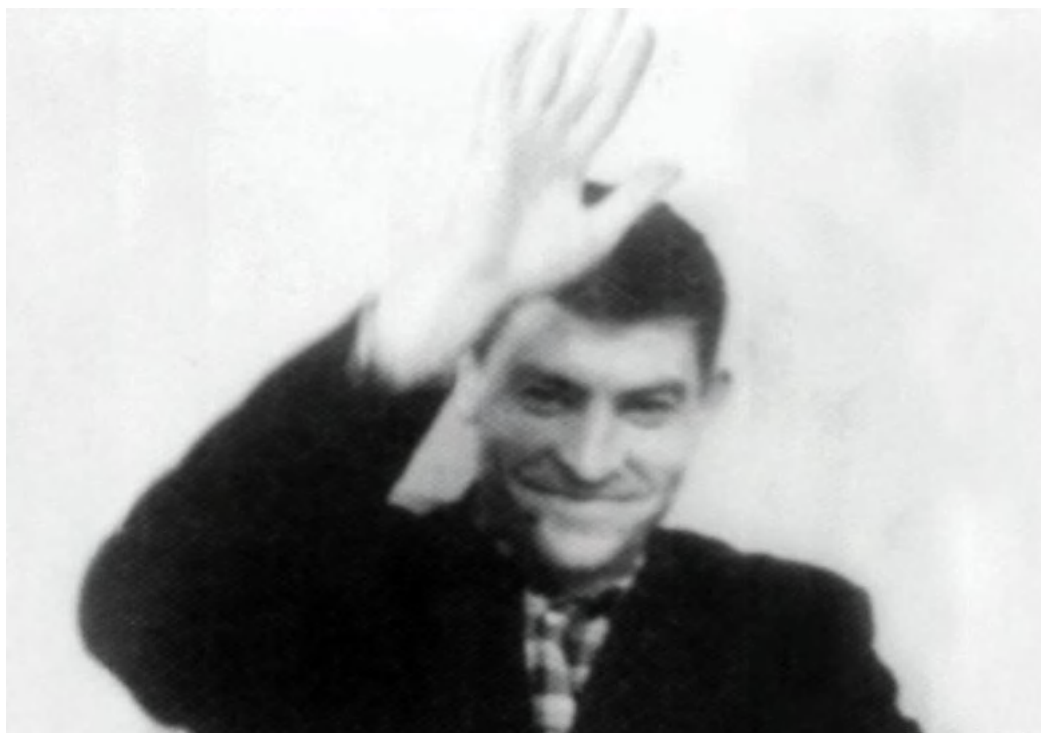
ВАСИЛЬ СТУС (1938–1985)